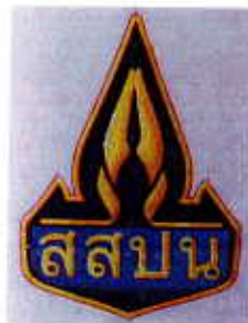
แบบที่ ๒ เครื่องหมายแสดงตราสัญลักษณ์ของสำนักงาน